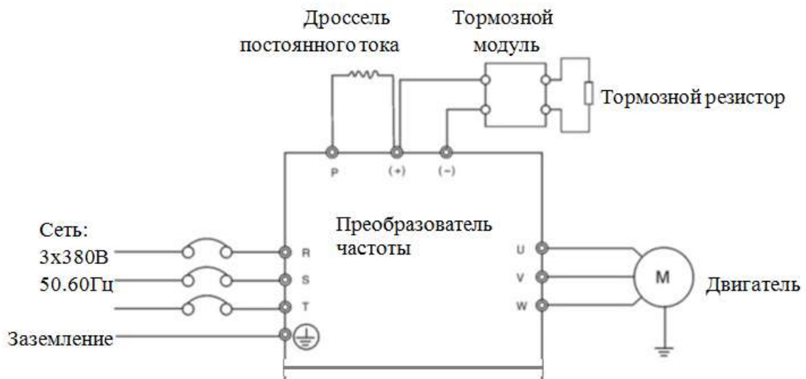
Рис. 5 Схема подключения тормозной резистора к преобразователю частоты через тормозной модуль (средние и большие мощности ПЧ)